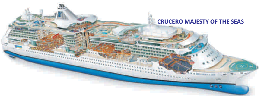
CRUCERO MAJESTY OF THE SEAS