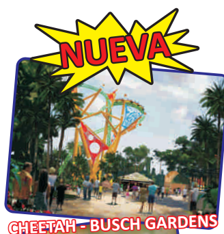
CHEETAH - BUSCH GARDENS

Pensión completa. Llegaremos a Coco Cay, Isla privada de ROYAL CARIBBEAN, esta isla tropical es un paraíso para aquellos que